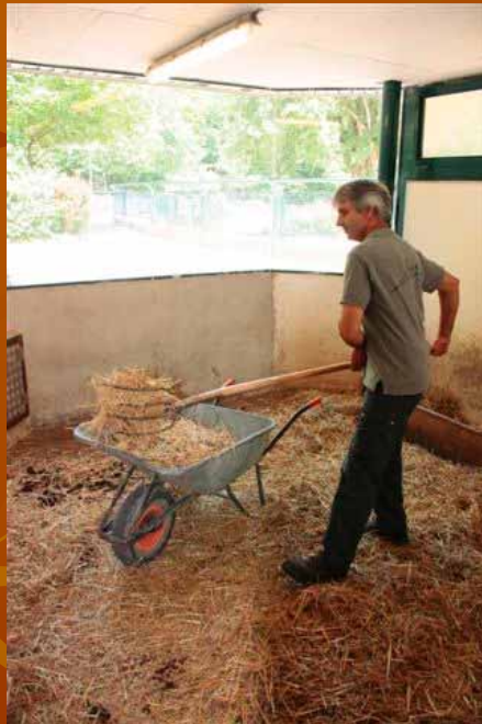
Changement des litières