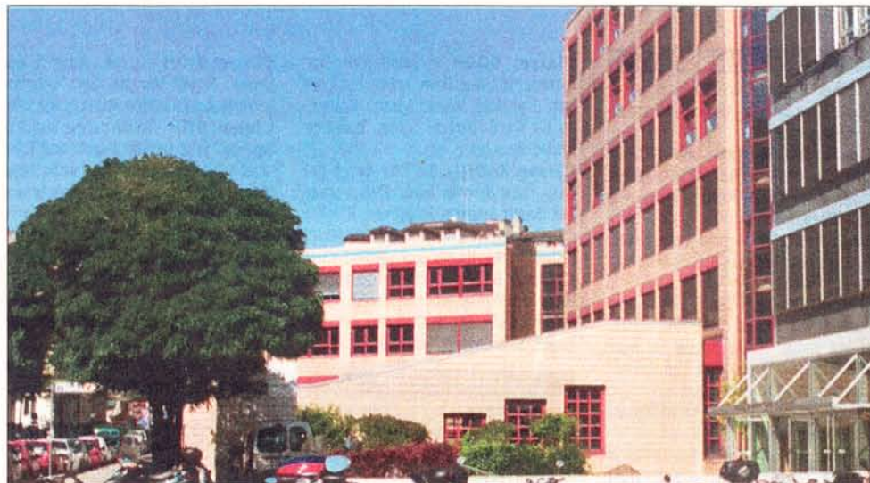
Haute école du paysage, d'ingénierie et d'architecture (hepia). C'est à la rue de la Prairie (photo) que les cours du soir en informatique et en télécommunications seront donnés.

Etudiants en informatique à hepia. Dans cette filière sont notamment enseignés les différents types de programmation, les systèmes d'information ou encore les réseaux et les proto-