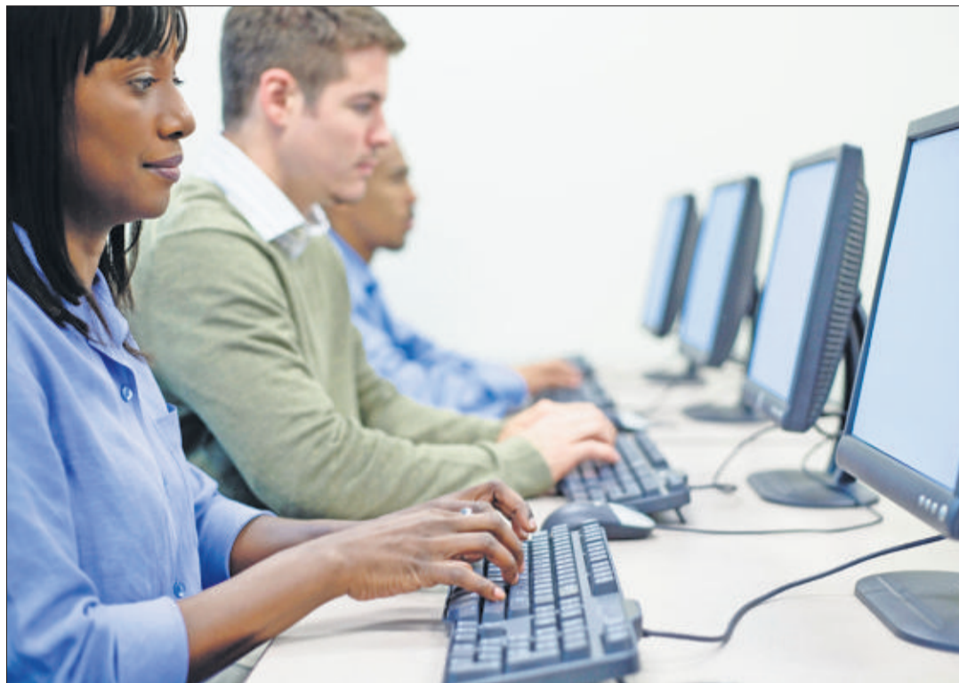
Métiers en mutation. Les travailleurs doivent s'attendre à changer plusieurs fois d'activité.